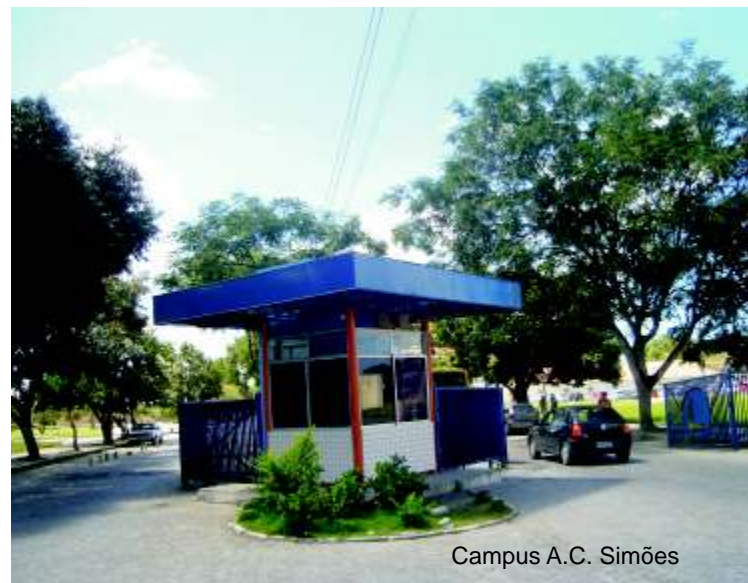
Campus A.C. Simões

Campus A.C. Simões , localizado na Avenida Lourival de Melo Mota, Tabuleiro do Martins, onde fica a reitoria, pró-reitorias e a maior parte dos cursos de graduação, pós-graduação e suas respectivas coordenações.