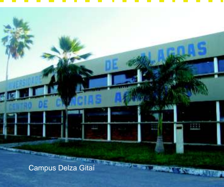
Campus Delza Gitaí

Campus Delza Gitaí , localizado em Rio Largo, no Km 85, BR-105, onde funciona o Centro de Ciências Agrárias - CECA, conta com os cursos de Agronomia e Zootecnia.