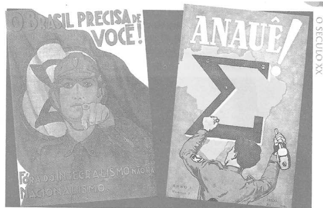
Cartazes de propaganda integralista, onde a exaltação nacionalista aparece junto ao símbolo do movimento, o sigma.

Durante o período em que Getúlio Vargas governou constitucionalmente a nação, dois grupos políticos com ideologias totalmente diversas ganharam destaque na vida pública brasileira. Tratava-se da Ação Integralista Brasileira e da Aliança Nacional Libertadora. A Ação Integralista Brasileira foi criada pelo escritor Plínio Salgado, que contou com o apoio das oligarquias tradicionais e de alguns setores elitistas da Igreja Católica. Neste contexto histórico, pode-se afirmar: