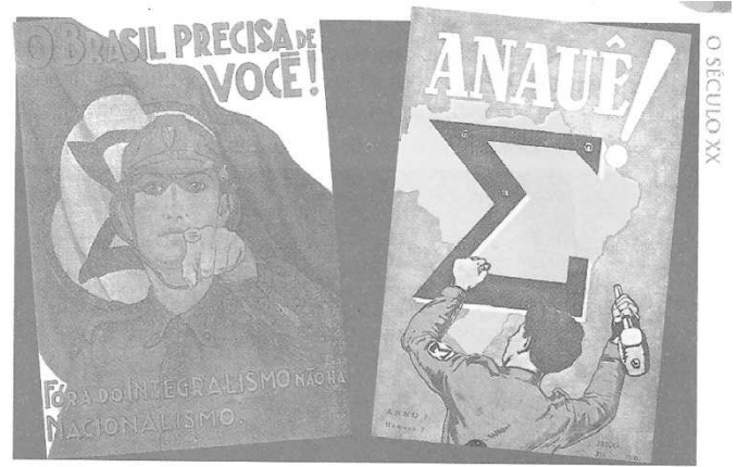
Cartazes de propaganda integralista, onde a exaltação nacionalista aparece junto ao símbolo do movimento, o sigma.

Durante o período em que Getúlio Vargas governou constitucionalmente a nação, dois grupos políticos com ideologias totalmente diversas ganharam destaque na vida pública brasileira. Tratava-se da Ação Integralista Brasileira e da Aliança Nacional Libertadora. A Ação Integralista Brasileira foi criada pelo escritor Plínio Salgado, que contou com o apoio das oligarquias tradicionais e de alguns setores elitistas da Igreja Católica. Neste contexto histórico, pode-se afirmar: