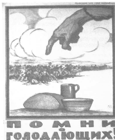
▲ Cartaz russo da época da Guerra Civil pedindo contribuições para ajudar a população que passava fome.

Após os bolchevistas vencerem a guerra civil, a economia russa estava arrasada. Ela regredira a níveis inferiores aos de antes de 1913, o que repercutia nas condições de vida da população. Ocorreu uma série de rebeliões entre os camponeses cansados do racionamento de alimentos e entre a população urbana. Para promover a reconstrução econômica do país, Lênin concebeu em março de 1921 a Nova Política Econômica (NEP), definida por ele como “um passo atrás para dar dois à frente”. A NEP consistiu na