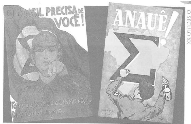
Cartazes de propaganda integralista, onde a exaltação nacionalista aparece junto ao símbolo do movimento, o sigma.

Durante o período em que Getúlio Vargas governou constitucionalmente a nação, dois grupos políticos com ideologias totalmente diversas ganharam destaque na vida pública brasileira. Tratava-se da Ação Integralista Brasileira e da Aliança Nacional Libertadora. A Ação Integralista Brasileira foi criada pelo escritor Plínio Salgado, que contou com o apoio das oligarquias tradicionais e de alguns setores elitistas da Igreja Católica. Neste contexto histórico, pode-se afirmar: