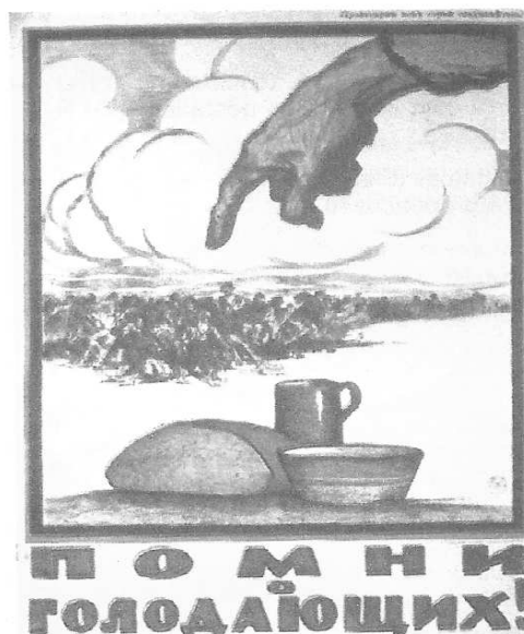
▲ Cartaz russo da época da Guerra Civil pedindo contribuições para ajudar a população que passava fome.

Após os bolchevistas vencerem a guerra civil, a economia russa estava arrasada. Ela regredira a níveis inferiores aos de antes de 1913, o que repercutia nas condições de vida da população. Ocorreu uma série de rebeliões entre os camponeses cansados do racionamento de alimentos e entre a população urbana. Para promover a reconstrução econômica do país, Lênin concebeu em março de 1921 a Nova Política Econômica (NEP), definida por ele como “um passo atrás para dar dois à frente”. A NEP consistiu na