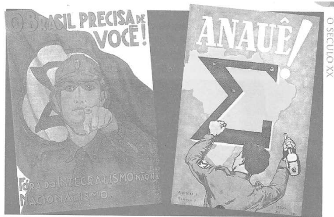
Cartazes de propaganda integralista, onde a exaltação nacionalista aparece junto ao símbolo do movimento, o sigma.

Durante o período em que Getúlio Vargas governou constitucionalmente a nação, dois grupos políticos com ideologias totalmente diversas ganharam destaque na vida pública brasileira. Tratava-se da Ação Integralista Brasileira e da Aliança Nacional Libertadora. A Ação Integralista Brasileira foi criada pelo escritor Plínio Salgado, que contou com o apoio das oligarquias tradicionais e de alguns setores elitistas da Igreja Católica. Neste contexto histórico, pode-se afirmar: