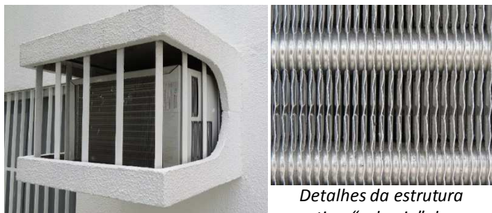
Detalhes da estrutura tipo "colmeia" do

37. A parte traseira dos aparelhos de ar condicionado de janela apresenta um tipo de dissipador de calor que possui uma estrutura que favorece a troca de calor com o ambiente externo. Essa estrutura é fundamental para o bom funcionamento do aparelho e sua função é, basicamente, transferir o calor do líquido de refrigeração que circula no equipamento para o ambiente externo.