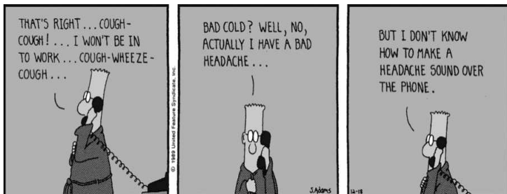
Dilbert Classics by Scott Adams Disponível em: http://www.dilbert.com/strips/ Acesso em 18/02/2013

37. Na tirinha acima, podemos inferir que a pergunta feita pelo interlocutor e respondida por Dilbert no 3º quadrinho é: