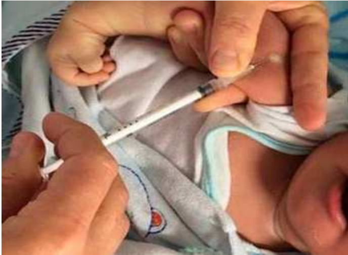
Administração de BCG em recém-nascido.

A BCG é uma vacina que previne contra as formas mais graves de tuberculose.