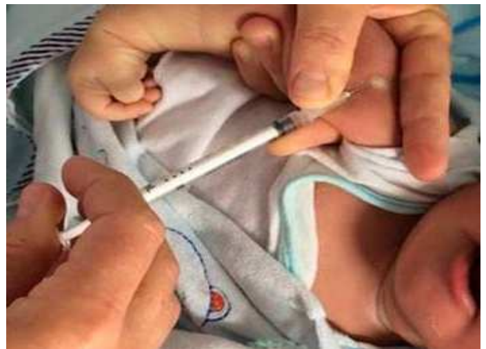
Administração de BCG em recém-nascido.

A BCG é uma vacina que previne contra as formas mais graves de tuberculose.