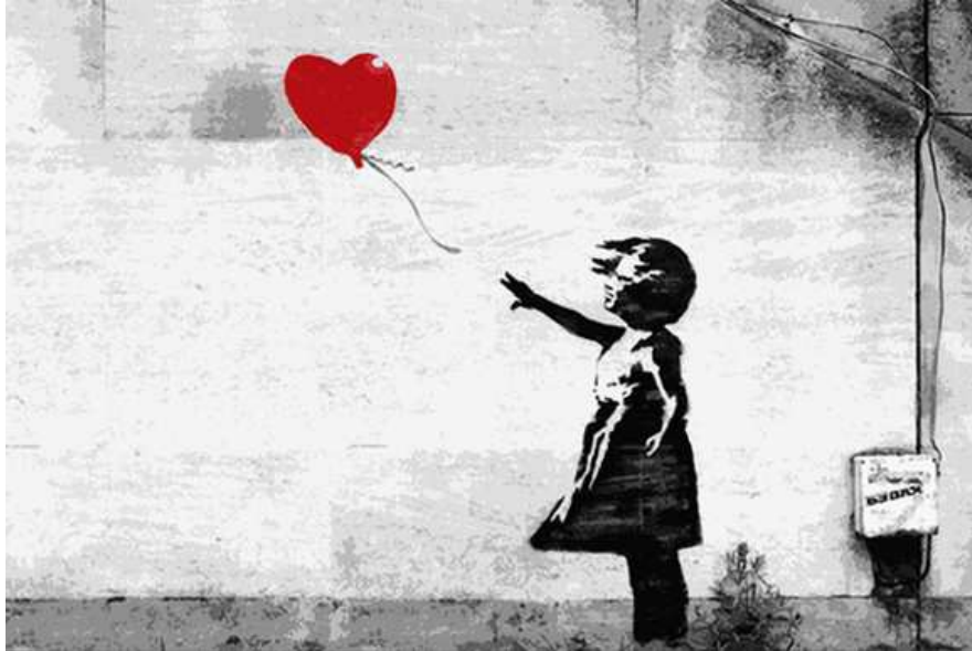
Banksy (2002) "Garota com um balão"

Com sua característica técnica de estêncil, Banksy tem se tornado um importante ativista da arte de rua mundial. O popular artista urbano deu a volta ao mundo espalhando seu estêncil por cidades como Londres, Barcelona, Palestina, Los Angeles ou em países como o Mali.