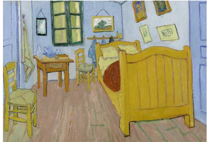
O QUARTO (VAN GOGH)

As questões 9 e 10 referem-se ao texto (apresentado em LIBRAS) e a imagem.