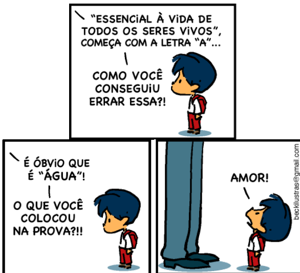
Disponível em: < http://opregadorpentecostal.blogspot.com.br/2014/08/noticias-gospel-neste-email-contem-40_29.html >. Acesso em: 29 set. 2015.

Quanto aos aspectos sintáticos presentes nos quadrinhos, assinale a alternativa correta.