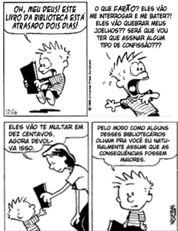
Disponível em: < http://aoleitor.blogspot.com.br/2011_07_01_archive.html >. Acesso em: 17 out. 2015.

Dadas as afirmativas sobre os elementos linguísticos que compõem a tirinha,