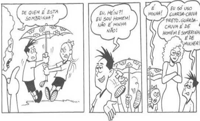
Disponível em: < https://meilycass.wordpress.com >. Acesso em: 10 nov. 2015.

Desde a Educação Infantil, a escola precisa refletir sobre suas atitudes e práticas educativas. Nesse sentido, a tirinha abaixo envolve discussão sobre a construção de valores ancorados em fundamentos de ética, direitos humanos e na igualdade de direitos e deveres entre homens e mulheres.