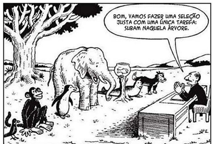
Disponível em: < http://www.feuc.br/revista/wp-content/uploads/2014/09/Avalia1.jpg >. Acesso em: 11 out. 2016.

A situação descrita no cartum está associada a que modelo pedagógico de avaliação?