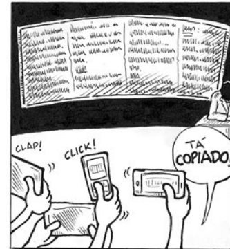
Disponível em: < https://professordigital.files.wordpress.com/2012/07/copiandoalouca.jpg >. Acesso em: 11 out. 2016.

No que concerne à atuação docente e à utilização das Tecnologias de Informação e Comunicação, a crítica da tirinha aponta o(a)