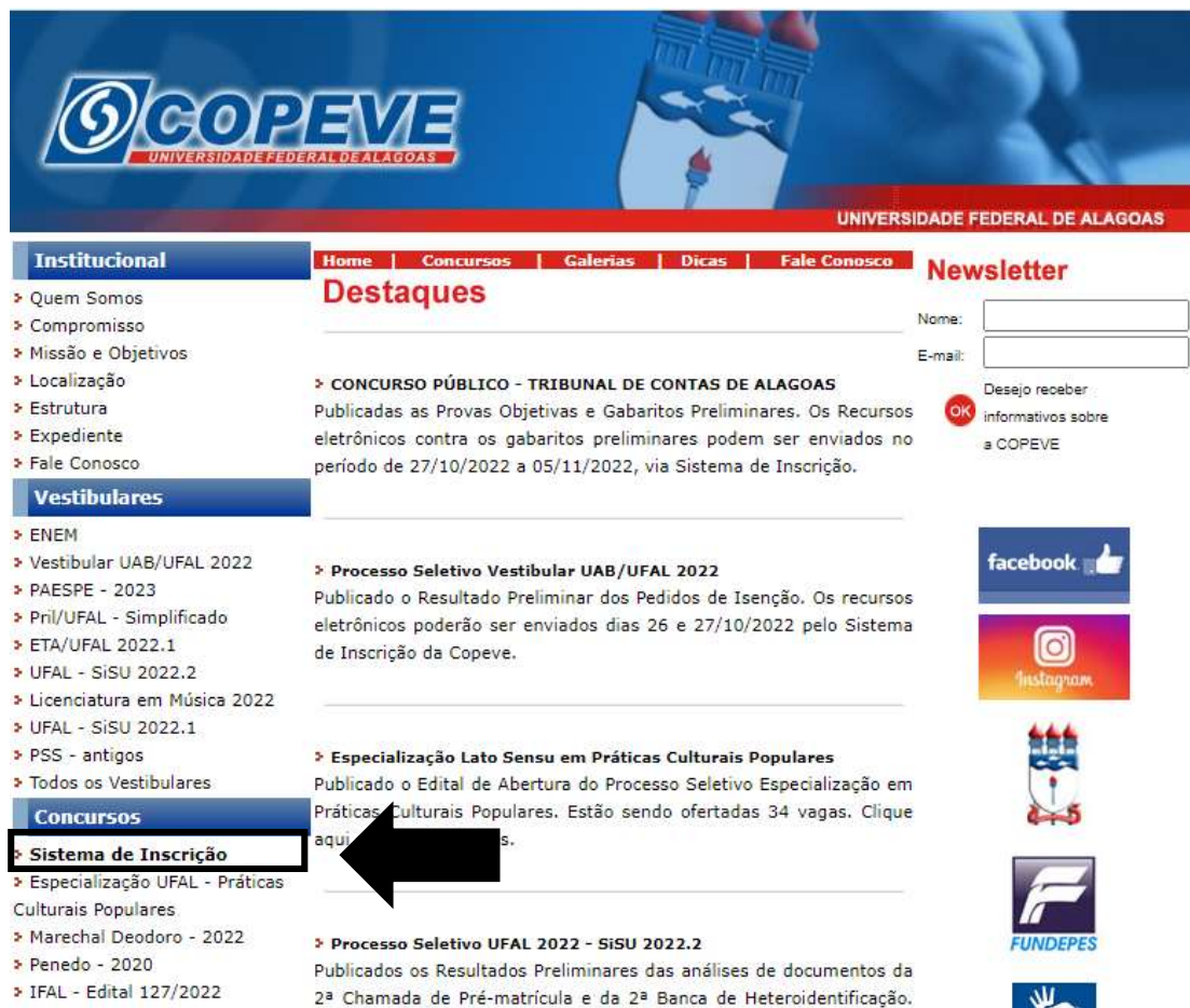
Figura 1 – Acessar Sistema de Inscrição