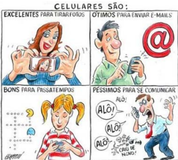
Disponível em: < http://domacedo.blogspot.com.br/2012/08/aprovada-cpi-da-telefonica-celular.html >. Acesso em: 22 nov. 2014.

Dadas as afirmativas abaixo quanto ao texto em questão,