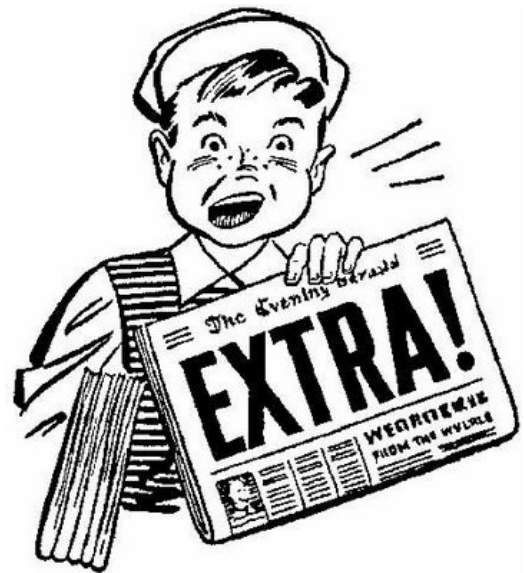
Disponível em: < http://dimassantos.com.br/manchetes-dos-principais-jornais/ >. Acesso em: 17 nov. 2014.

Qual a categoria gramatical da palavra “EXTRA!”, exclamada na figura?